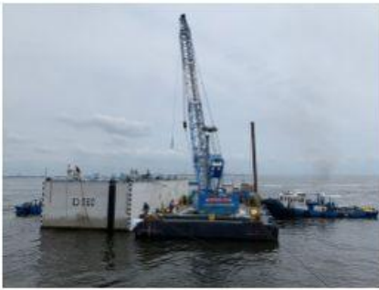
2020 新海面Dブロック 南側護岸建設工事