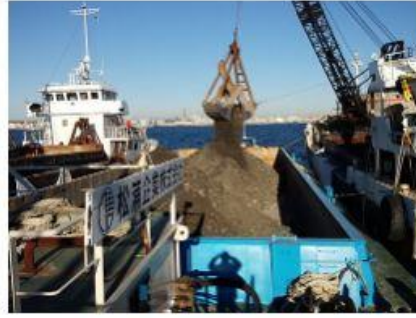
2015 南本牧地区岸壁(-18m) 築造工事(その2)