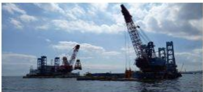
2022 新本牧建設工事 (その22・23)