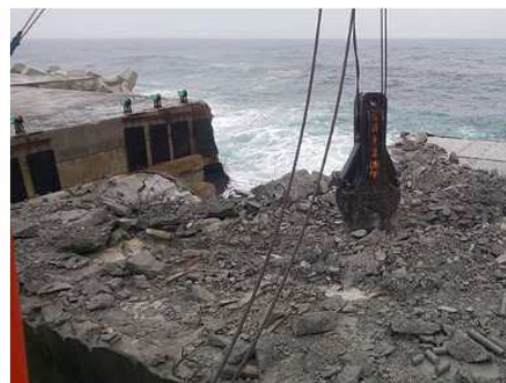
2018 むつ小川原港防波堤 (災害復旧築造)工事