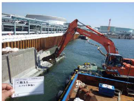
2018 JXTG根岸護岸復旧工事