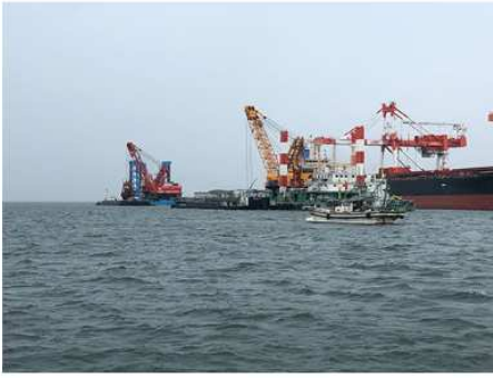
2019 宇部港本港地区(-14m) 浚渫工事