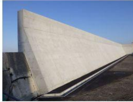
2020 本牧D突堤災害復旧工事・パラペ ット嵩上げ工