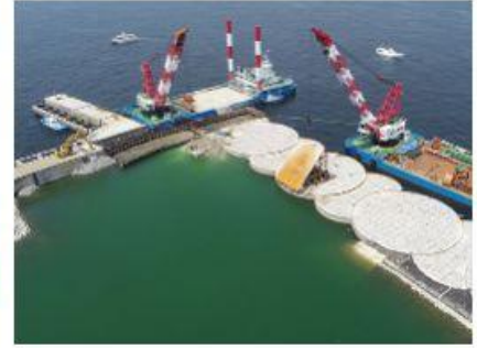
2018 南本牧MC-4岸壁裏込工事