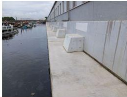
2021 日産自動車横浜工場 陥没補修工事