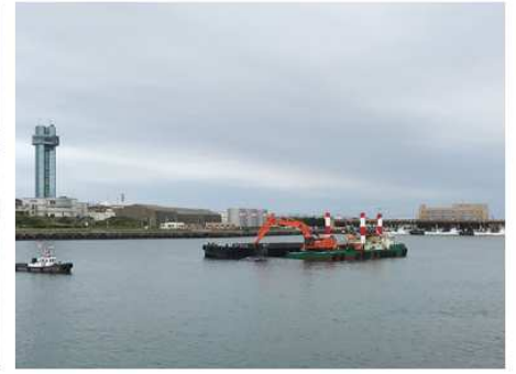
2021 銚子漁港流通基盤整備工事