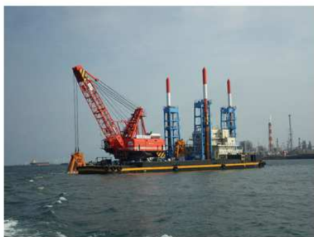
2017 鹿島港外港地区浚渫工事