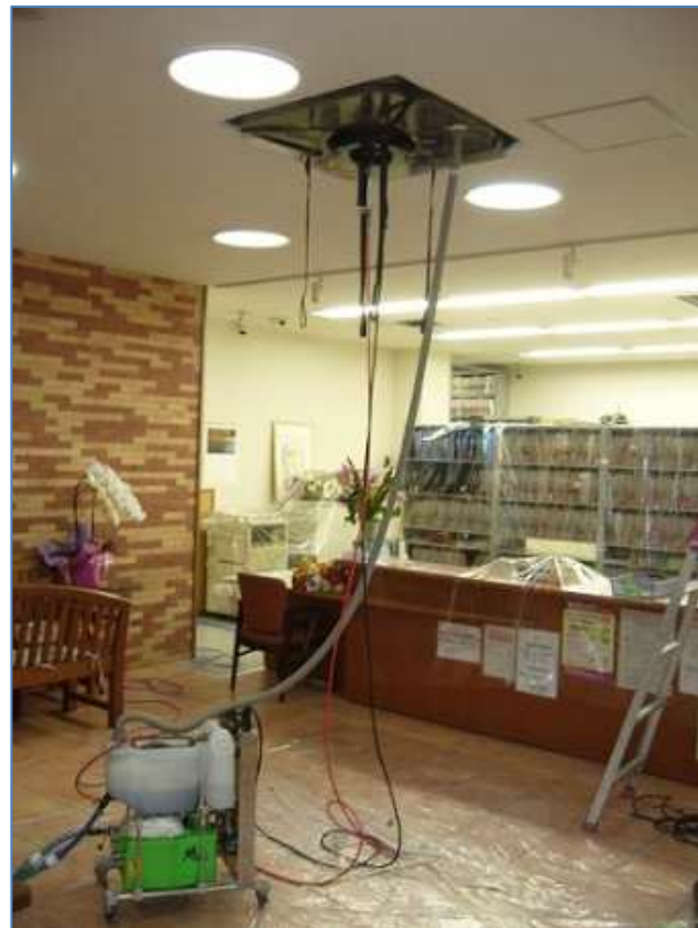
超高圧エアコン洗浄ロボットにて洗浄作業中