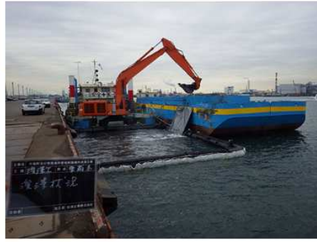
2019 千鳥町及び東扇島岸壁 浚渫工事