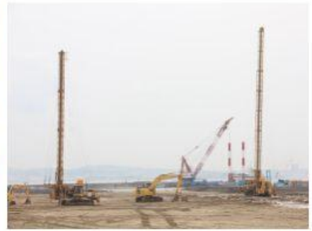
2018 南本牧埋立工事(第4ブロック地 盤改良工その14)