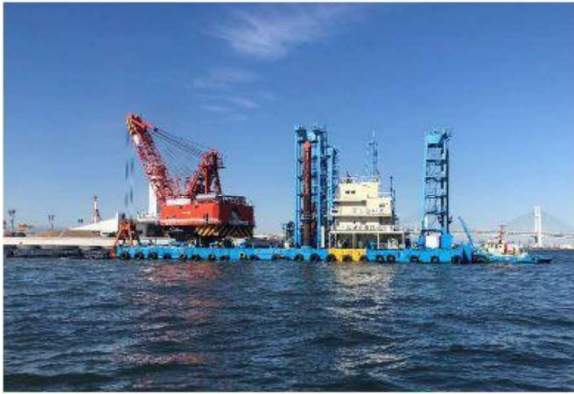
第七金剛丸 30m 2 級クラブ浚渫船