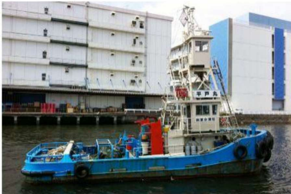
平戸丸 押船兼引船