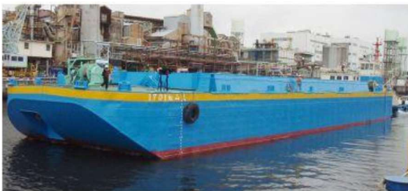
1701松山丸 全開式 土運船