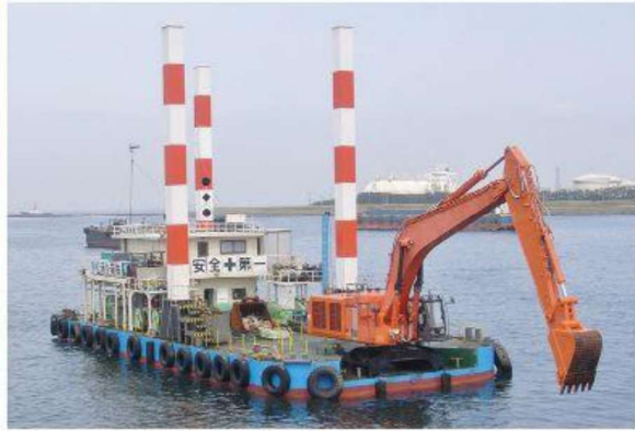
第三隆盛丸 バックホウ浚渫船