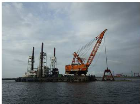
2013 南本牧ふ頭第5ブロック 建設工事(その34)