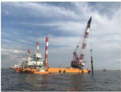
2021 新本牧建設工事(その13)