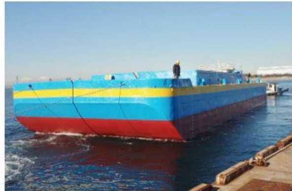
701松山丸 全開式 土運船