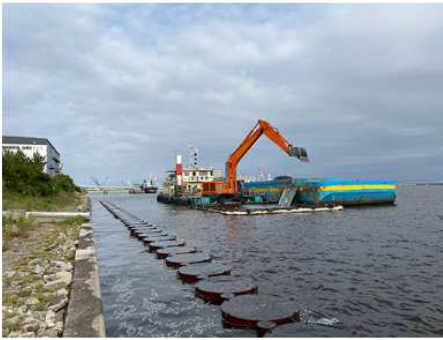
2021 東雲防潮堤建設工事 (その3)