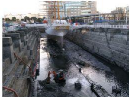
2019 日本丸ドック浚渫及び 排水工事