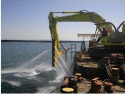
2015 南本牧ふ頭第5ブロック 建設工事(その54)