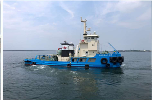
第38安芸丸 押船兼引船