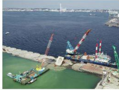
2018 南本牧MC-4岸壁裏込工事