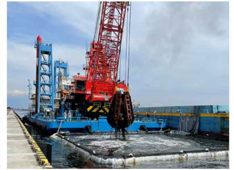
2022 大黒ふ頭岸壁改良工事 (その7)