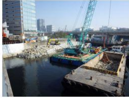
2019 東品川橋架替工事(その3)