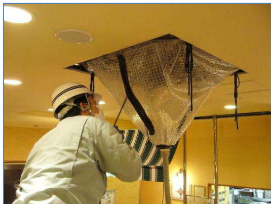
高圧洗浄にて清掃作業中