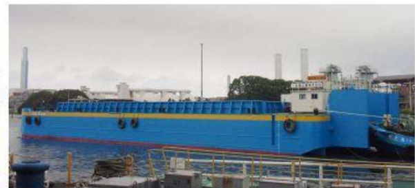
1702松山丸 全開式 土運船