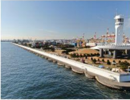
2020 本牧D突堤災害復旧工事・パラペ ット嵩上げ工