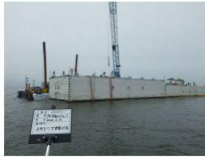
2020 新海面Dブロック 南側護岸建設工事