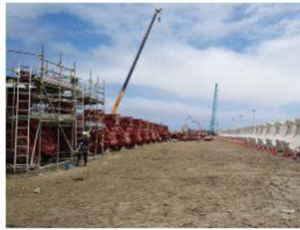
2016 鹿島港外港地区中央防波堤付属 施設消波工事（その3）