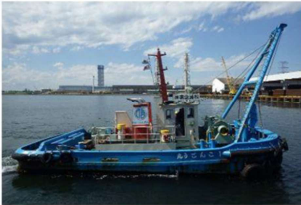
1こんごう丸 押船兼揚錨船