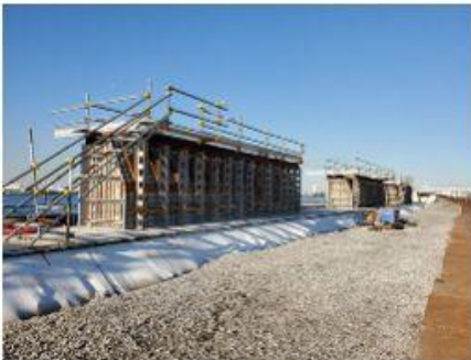
2020 浮島2期廃棄物埋立護岸 災害復旧工事