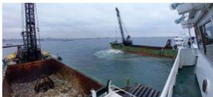
2022 新本牧建設工事 (その22・23)