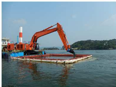
2013 仙台塩釜港塩釜港区 (-7.5m)浚渫工事