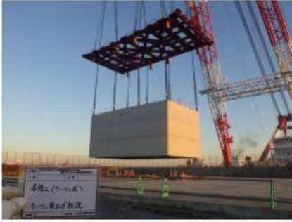
2016 南本牧ふ頭5ブロック 建設工事(その74)