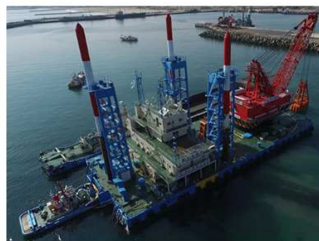
2017 常陸那珂港打継場浚渫工事