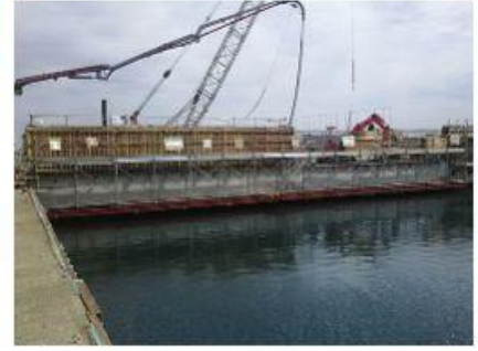
2016 南本牧ふ頭5ブロック 建設工事(その74)