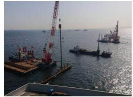
2021 新本牧建設工事 (その10・12・13)