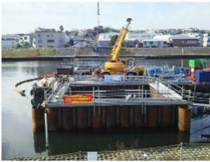
2015 鶴見川水管橋撤去工事