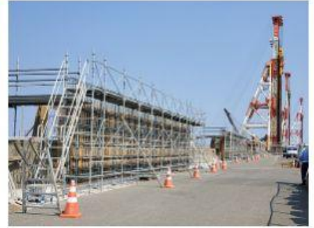
2020 本牧D突堤災害復旧工事・パラペ ット嵩上げ工