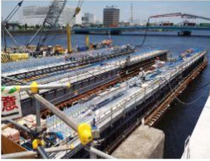
2016 中央防波堤外側埋立地 物揚場建設工事