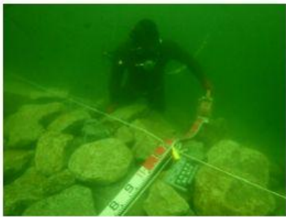
2021 新本牧建設工事(その13)