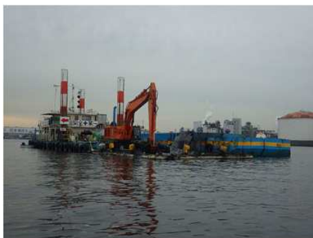
2017 殿町羽田空港線内航路 浚渫工事