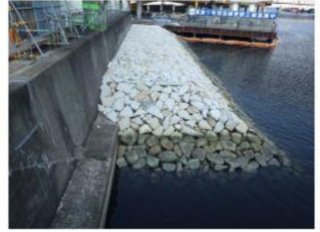
2020 天王洲南運河防潮堤 建設工事