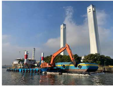
2022 三菱ケミカル浚渫工事