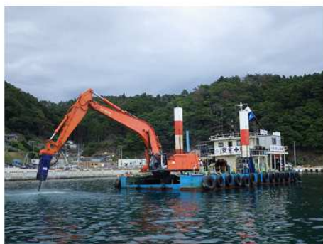
2015 佐藤造船所(宮城県石巻) 工場新築工事