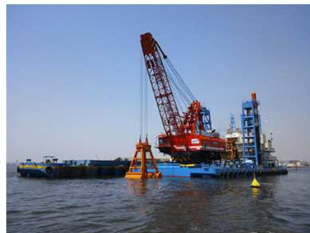
2013 平成25年度市川泊地 浚渫工事